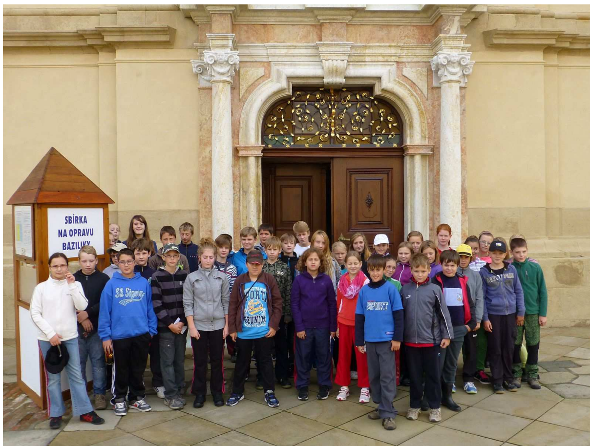
Účastníci exkurze před bazilikou na Velehradě

Na Velehradě jsme se podívali do baziliky, která je postavena v barokním slohu. V bazilice se mi velmi líbilo, viděli jsme v ní také hrob kardinála Tomáše Špidlíka. Potom jsme si zvenku prohlédli kapličku v gotickém slohu. Cestou zahradami ke kapličce jsme viděli řadu soch svatých. V areálu bývalého kláštera byla i mateřská škola.