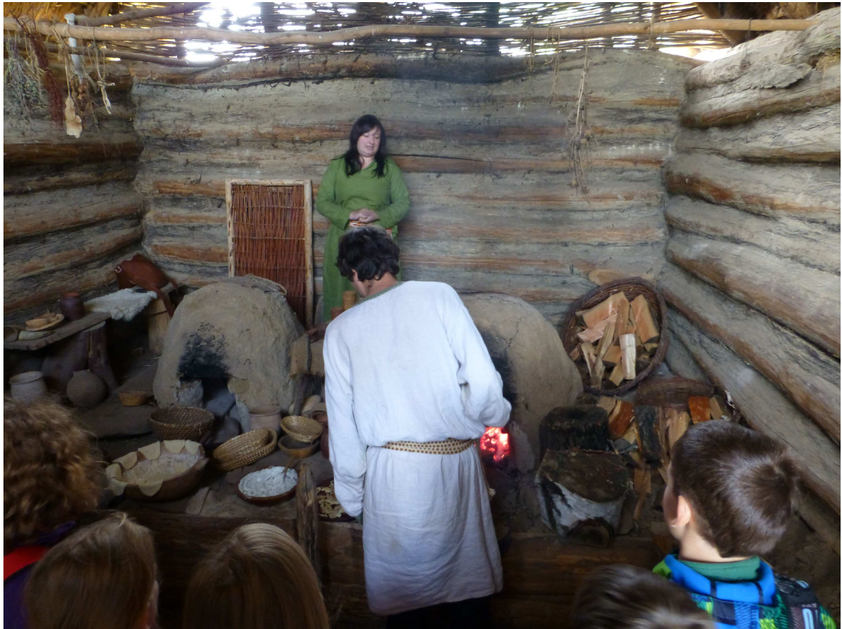
V takových pecích se na Velké Moravě pekly placky

zkusily psaní hlaholice a někteří kluci zase vyzkoušeli křesadlo. Zahřáli jsme se ve starodávné pekárně, kde byly hned dvě pece. Na konci zajímavého výkladu jsme každý dostali už upečené placky s pomazánkou.