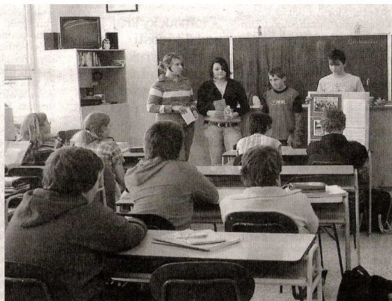
Organizátoři projektu zvou ve třídách spolužáky na výstavu.