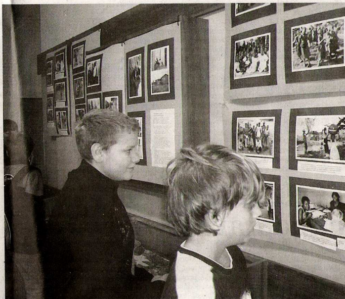
Autorkou fotografií z Ugandy je Dana Šafářová.

Text: Ivana Krížková a Dagmar Hajtmarová z Dubicka, foto: Ivana Krížková