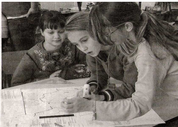
Pářáci hledali zeměpisné a hospodářské informace o Ugandě.