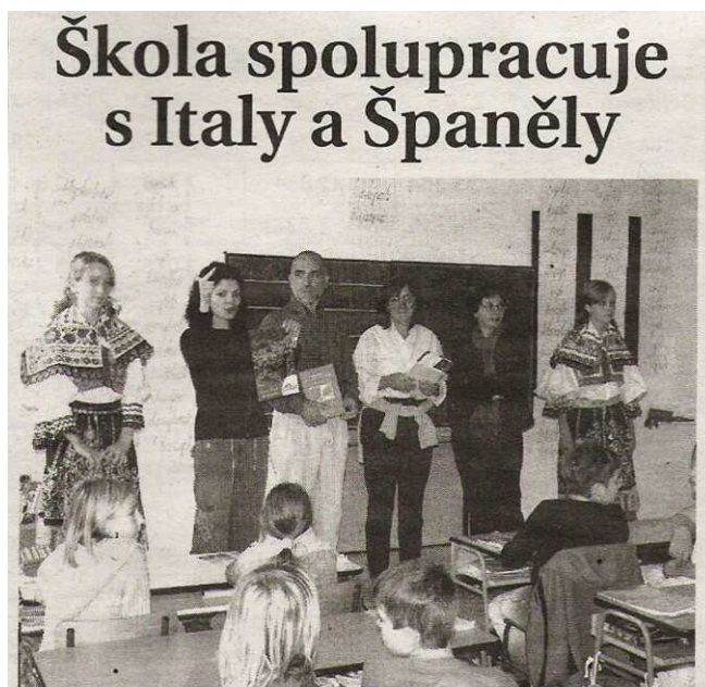
Učitelé ze Španělska a Itálie představují školám v Dubicku město a kraj, ve kterém žijí.

Dubicko - Základní školu v Dubicku navštívili učitelé z Itálie a Španělska. Ti zareagovali na nabídku školy zúčastnit se tříletého projektu zaměřeného na podporu četby školáků a rozšíření jejich znalostí o zahraniční literaturu.