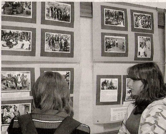
O výstavu fotografií byl velký zájem.